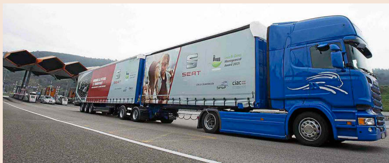
Sesé, que suma ya dos camiones de 25,25 metros, hizo ayer el primer trayecto entre Palau-solità y la planta de Seat, en Martorell (Barcelona).

© Unidad Editorial, Información Económica SLU, Madrid 2016. Todos los derechos reservados. Esta publicación no puede ser -ni en todo ni en parte- reproducida, distribuida, comunicada públicamente ni utilizada o registrada a través de ningún tipo de soporte o mecanismo, ni modificada o almacenada sin la previa autorización escrita de la sociedad editora. Conforme a lo dispuesto en el artículo 32 de la Ley de Propiedad Intelectual, "queda expresamente prohibida la reproducción de los contenidos de esta publicación con fines comerciales a través de recopilaciones de artículos periodísticos".