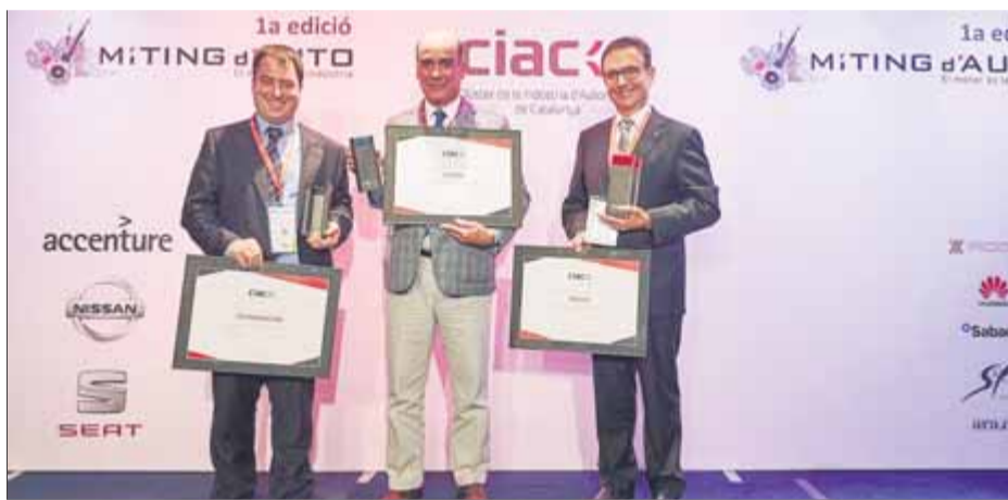
Els responsables de les tres empreses premiades pel CIAC ■ EL PUNT AVUI

viatgers de Vueling. A escala europea, Easy Jet es postula com l'aerolínia favorita dels viatgers (22,1%), seguida de Ryanair (18,2%) i Norwegian (11,7%). Segons l'estudi, Ryanair és l'aerolínia baix cost menys valorada. Així ho afirmen el 59,6% dels usuaris de l'enquesta elaborada per eDreams, que determinen que Ryanair és la que més costos ha afegit als seus bitllets. ■ REDACCIÓ